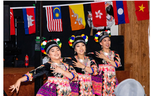
Hmong dancers at the Night Market