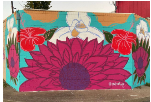
"Dahlia Con Amigos" mural

Organización de dos días de limpieza comunitaria con más de 25 voluntarios.